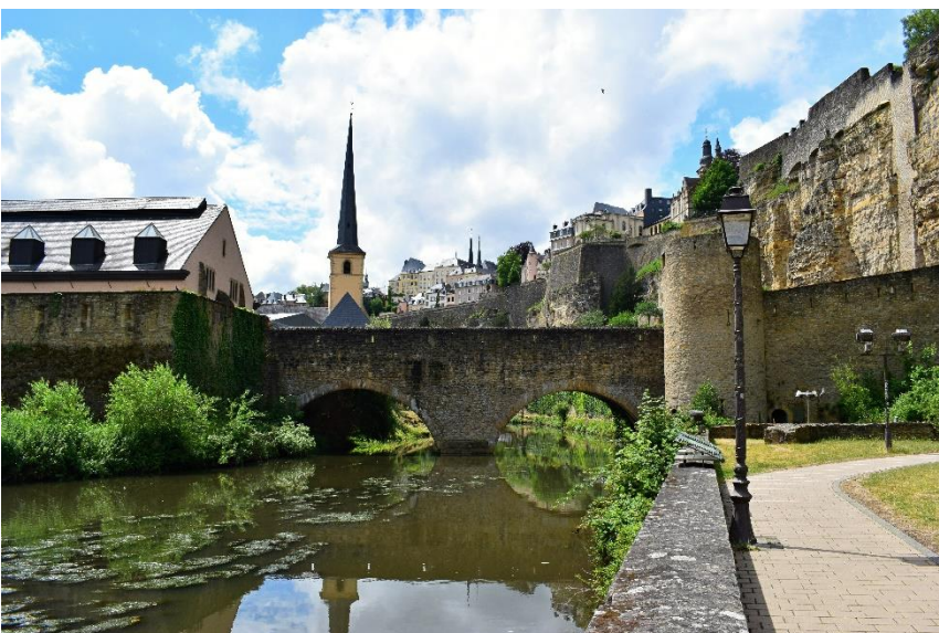
Obrázek č. 7: Prohlídka města Lucemburk.