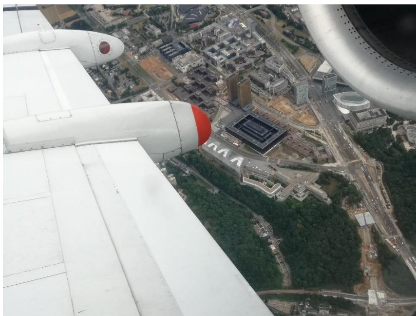
Obrázek č. 1: Pohled na areál Evropského soudního dvora z letadla.