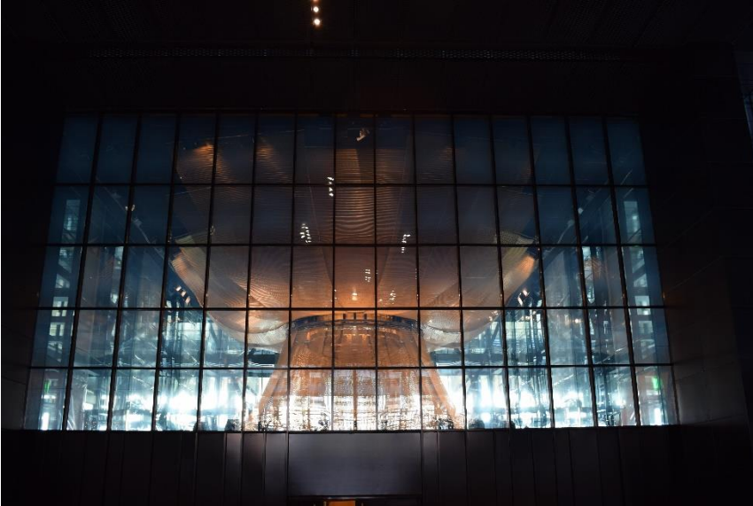
Obrázek č. 5: Pohled na stropní dekoraci hlavní soudní síně.

V rámci spolupráce s Evropským dokumentačním střediskem Právnické fakulty MU bylo zajištěno budoucí vzájemné sdílení materiálů. Tato dohoda se zakládá na příslibu, že Právnická fakulta bude pravidelně nabízet neprodejné publikace ze své produkce pro potřeby Soudního dvoru. Zároveň pro uživatele Evropského dokumentačního střediska vzniká možnost zažádat o materiály z fondu Evropského soudního dvoru.