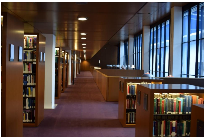
Obrázek č. 3: Jedno z pater knihovny Evropského soudního dvora.

Soudního dvora je francouzština, tak i veškerá katalogizace, komunikace a označení v knihovně jsou v tomto jazyce. Samotná katalogizace pak vychází z AACR2 pouze s drobnými odchylkami a úpravami.