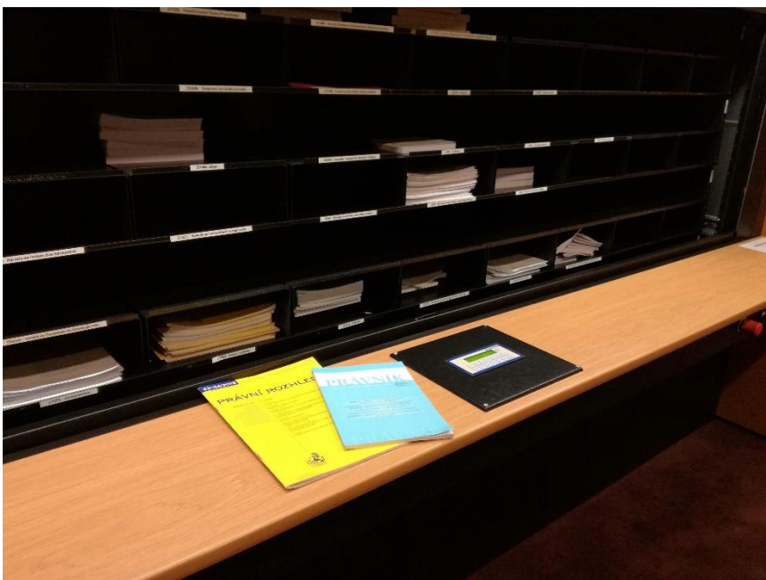
Obrázek č. 4: Výtah pro časopisy, označený jako páternoster.

V knihovně je k dispozici přes tisíc periodik. Ta jsou umístěna ve výtahu a uživatel si dle seznamu může vybrat aktuální ročník časopisu. Tento ročník mu je k nahlédnutí přivezen výtahem.