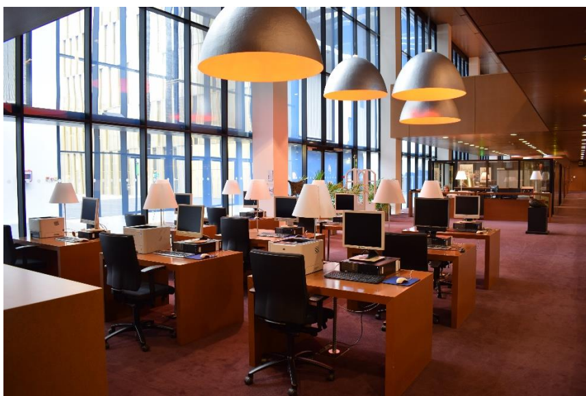
Obrázek č. 2:

literatury zahrnující především právo Unie, mezinárodní právo, srovnávací právo, národní práva a obecnou teorii práva, je součástí fondu také ekonomie, politika, společenské a správní vědy a dokonce i knihovnictví. V současných prostorách se nachází od roku 2004 a k dispozici má, kromě rozsáhlých skladů, tři rozlehlá patra, které jsou věnována publikacím a časopisům z oblasti evropského práva a práva jednotlivých členských států Evropské unie. O chod a provoz celé knihovny se stará přibližně třicet zaměstnanců, kteří jsou složeni s knihovníků členských států EU a také s tzv. administrátorů, jenž mají právnické vzdělání a zastupují zde také jednotlivé členské státy. Společně s akvizitery se podílejí na výběru vhodných publikací, pokrývajících právní problematiku daných států, a zároveň uspokojujících potřeby uživatelů fondu. Knihovna svou činností podporuje především práci soudců a dalším zaměstnanců Soudního dvora, je ale v případě zájmu přístupná i veřejnosti. Veškerý její fond je však výhradně prezenční.