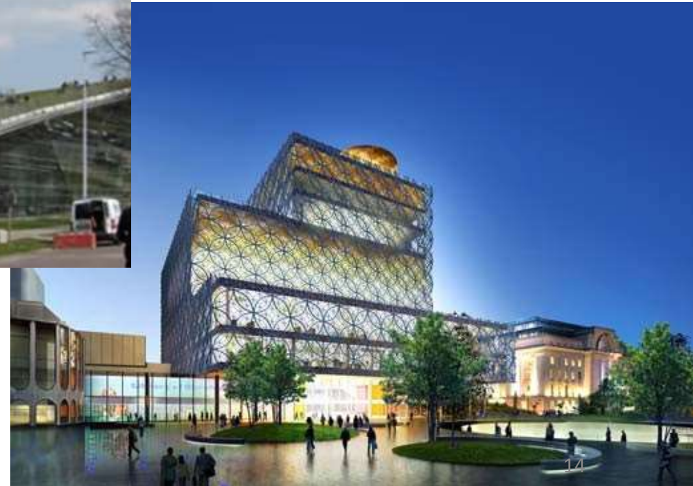
TU Delft library