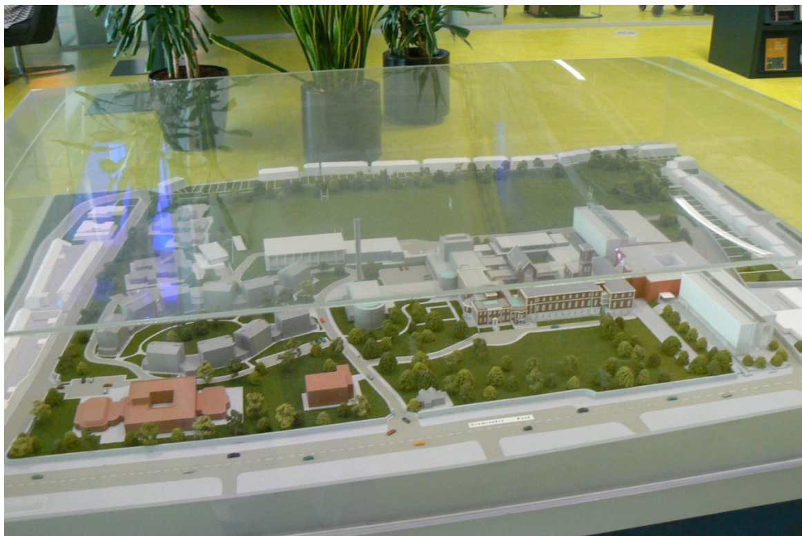
Maketa kampusu St. Patrick College.

St. Patrick'College je katolická pedagogická škola. Vyučuje se na ní i religionistika, protože se z Irska a zejména z Dublinu stává multikulturní společnost a školy navštěvuje stále více menšin, které vyznávají rozdílná náboženství.