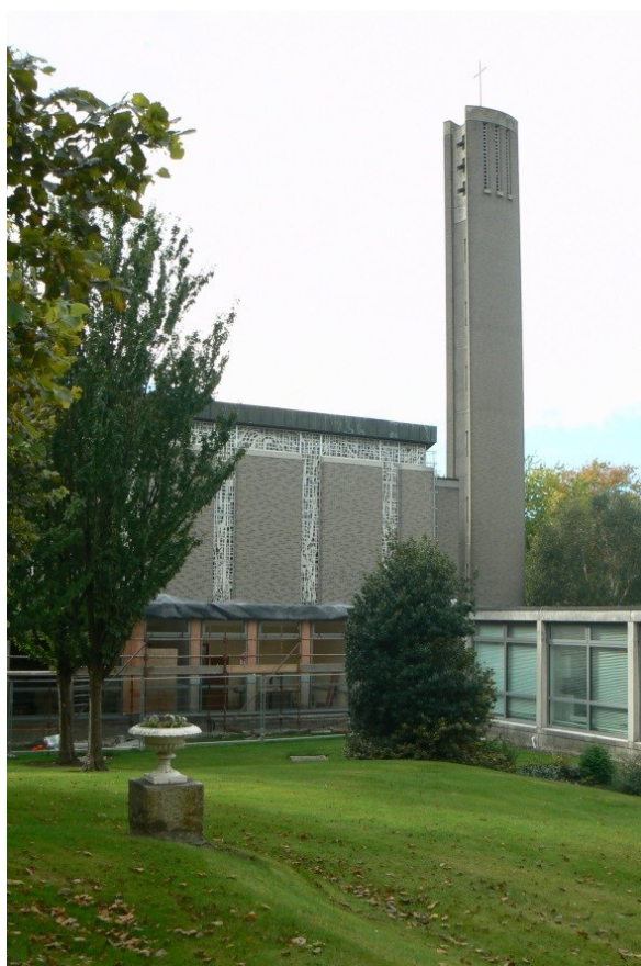
Kaple sv. Patrika

Pondělí 12.10. 2015 - Prohlídka kampusu a knihovny.