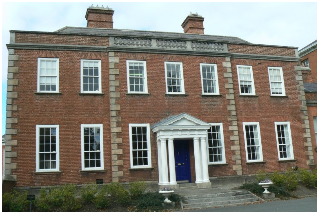
Belveder House, nejstarší budova v kampusu (od roku 1540.)