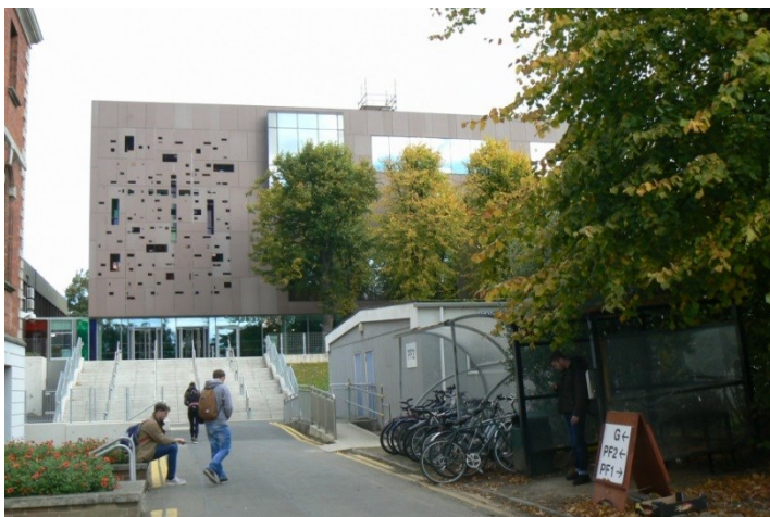
Exteriér nové knihovny.

V pracovním týdnu od 12. do 16.10. 2015 mi irští kolegové připravili program pro seznámení s jejich vysokou školou zejména knihovnou.