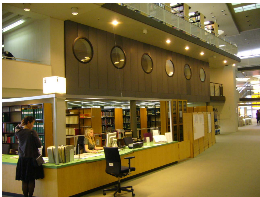
Interiér budovy v ulici Potsdamer Strasse, nad informačním pultem se nachází badatelný