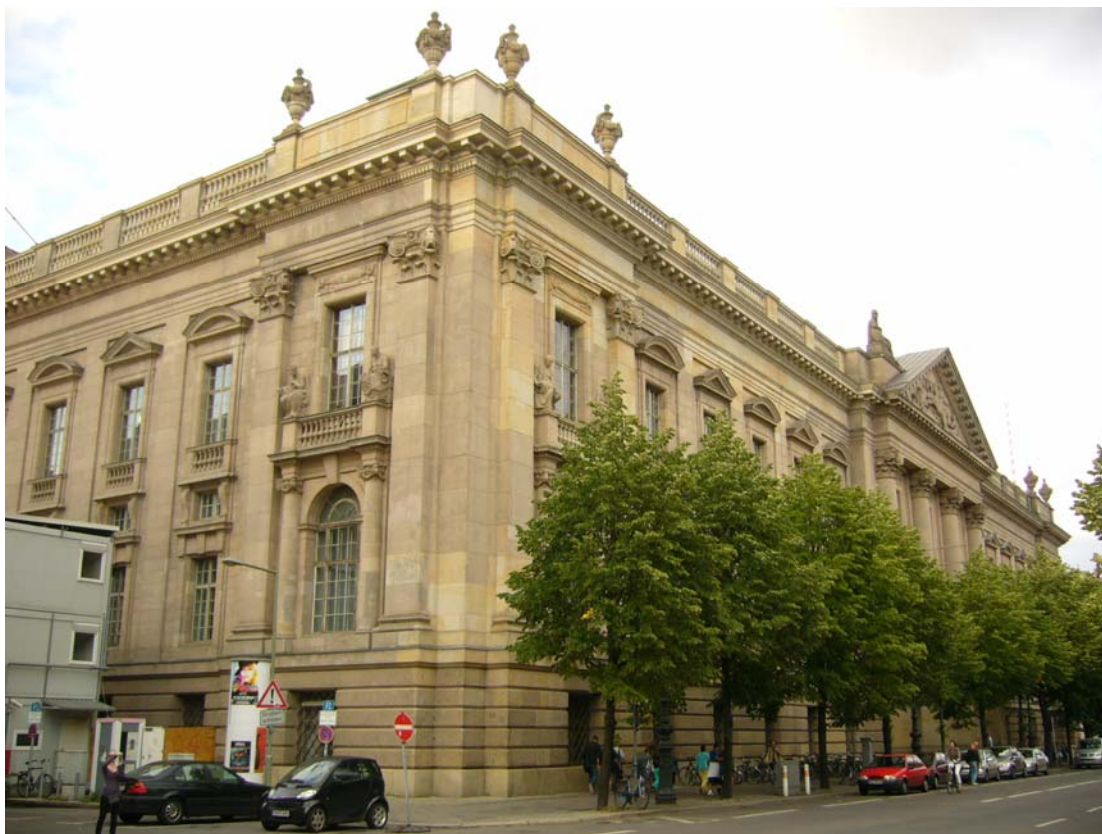
Staatsbibliothek zu Berlin, budova v ulici Unter den Linden