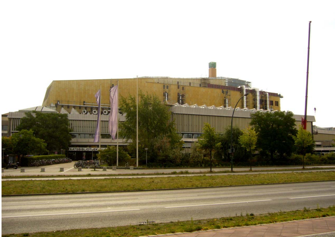
Staatsbibliothek zu Berlin, budova v ulici Potsdamer Strasse