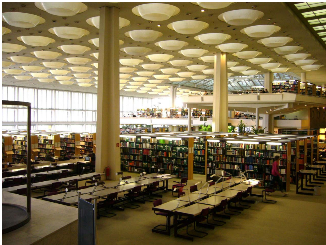
Interiér budovy v ulici Potsdamer Strasse, pohled do studoven