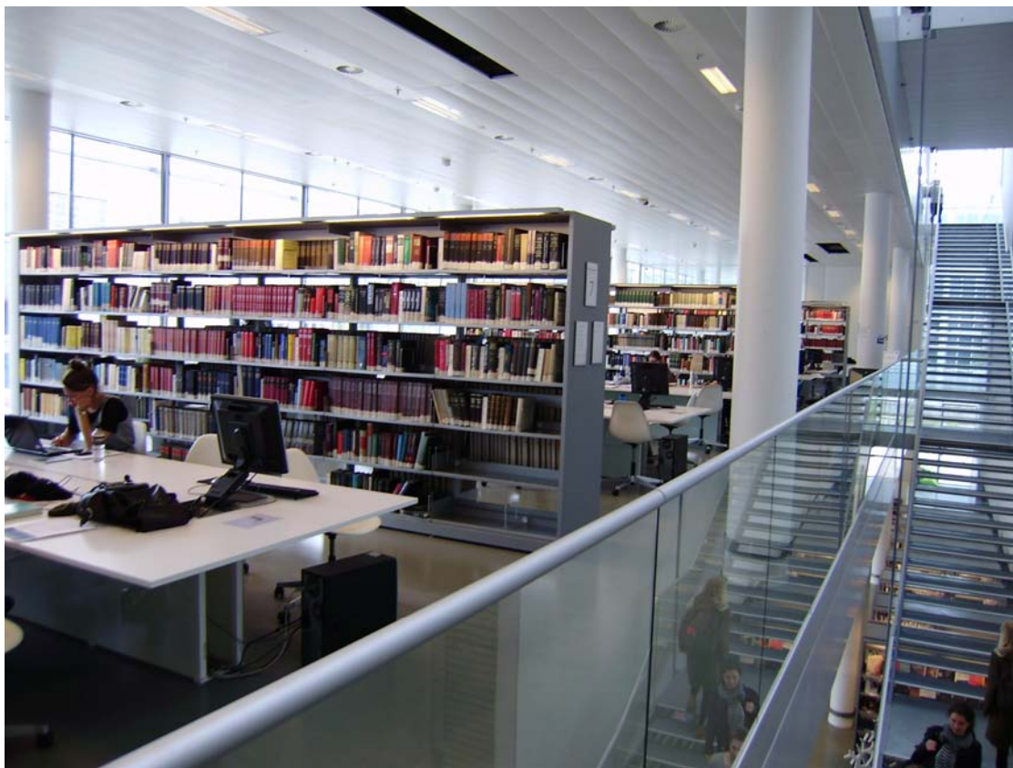
Knihovna humanitní fakulty