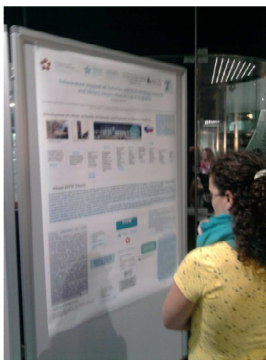
Obrázek 1: Posterová sekce v David Lubin Memorial Library

k nim má přistupovat knihovník. Poster nesl titulek: Blue economy means also ecology. Let us develop a blue communication between librarians and readership.