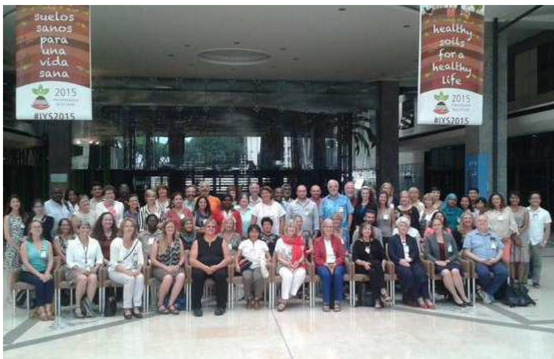
Obrázek 3: Účastníci 41st IAMSLIC Annual Conference

Příspěvek o spolupráci knihoven z oblasti Ruska, Ukrajiny a zemí bývalého Sovětského svazu v oblasti informační podpory mořského a rybářského výzkumu. Knihovny v rámci skupiny ODINECET budují a spravují dva institucionální repozitáře – IBSS (Sevastopol, Krym) a RuFIR (VNIRO, Moskva) a jeden korporátní repozitář CEEMaR e-Repository zaštitěný mezivládní oceánografickou komisí UNESCO ( IODE ). Do projektu je aktuálně zapojeno 18 knihoven z 5 zemí střední a východní Evropy. Tyto zdroje v knihovně FROV zajisté využijeme a nevím, zda bych se o nich bez vyslechnutí tohoto příspěvku vůbec dověděla.